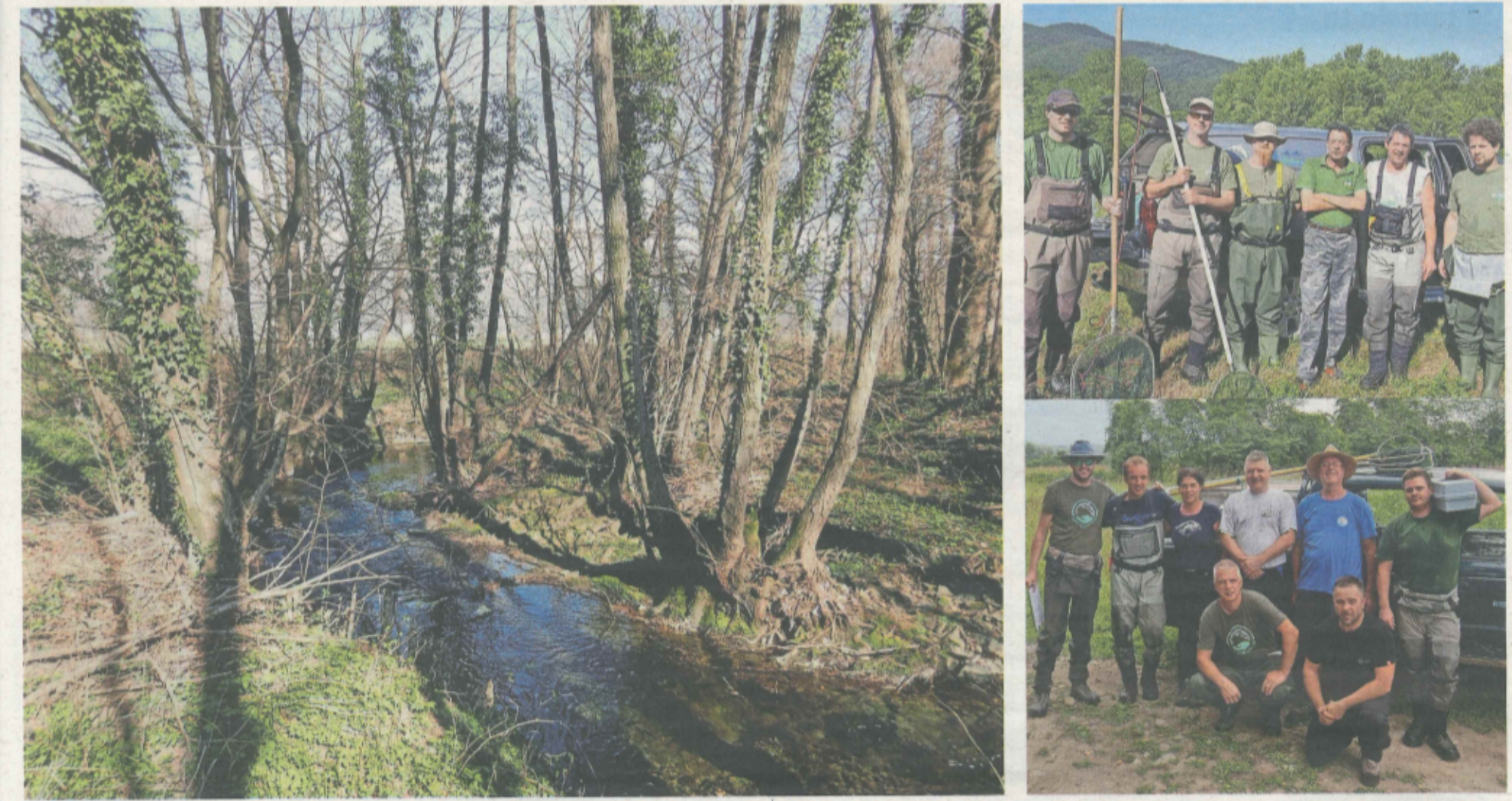
Potok Jovšček zgodaj spomladi. Odsek potoka Jovšček nad krajem Ustje pri Ajdovščini je eden redkih območij v Vipavski dolini, ki v preteklosti ni bil podvržen regulacijam. Tu smo pričr naravnemu dihanju potoka, ki ima ohranjene naravne brežine in okljuje.

Le-te upravljajo z vodo, so koncesionarji in so pravi poznavalci lokalnih razmer v naravi. Njihovo delo velja za častno in sloni na prostovoljni osnovi. Izjemno smo ponosni, da lahko sodelujemo z ribiškim družinama Ajdovščina in Renče, kajti imeti ob sebi tako imenitno skupino oseb, ki nam pomaga uresničevati cilje projekta je res, povalje vrednoti! Na celotnem območju projekta in tudi širše ponosno sodelujemo tudi z drugimi partnerji: Ribiška družina Soča-Nova Gorica, Občina Vipava, Občina Ajdovščina, Občina Renče - Vogrsko, Občina Šempeter - Vrtojba, Mestna občina Nova Gorica, Občina Kobarij, Občina Brda, Občina Miren - Kostanjevica, Agencija Republike Slovenije za okolje, Ministrstvo za kmetijstvo, gozdarstvo in