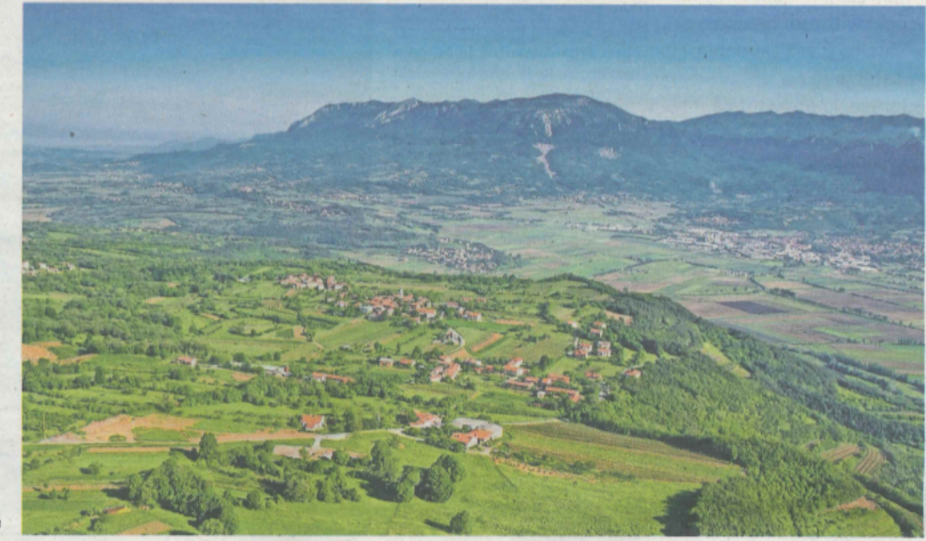
Vipavska dolina, Natura 2000 območje v katerem je ponovno zaživela primorska podust.

Life for Lasca je mednarodni projekt, ki se zavzema za ohranitev ribje vrste primorska podust, ki je na robu izumrtja. Vrsta živi le v Italiji in Sloveniji. Pri nas jo izvorno najdemo še v Brdih na Gorškem; danes pa tudi v Vipavski dolini, kamor smo jo v okviru projekta LIFE for LASCA uspešno ponovno naselili. V preteklosti je primorska podust iz Vipavske doline izginila predvsem zaradi obsežnih regulacij vipavskih vodotokov v drugi polovici 20. stoletja in prisotnosti tujerodne vrste podust s katero tekmujeta za isti življenjski prostor.