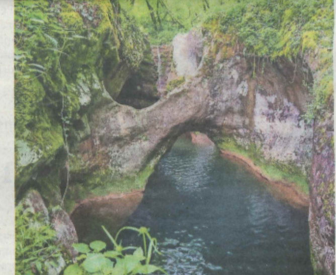
Krčnji, naravni spomenik v Brdih na Gorškem. Primorska podust se je v Sloveniji ohranila le še v Brdih.

Primorska podust Primorska podust je do 20 cm dolga ribica in je značilna vrsta primorja. Prepoznamo jo po izrazito ustičnih podstojnih ustih, ki imajo hrustančno ploščico. Prehranjuje se z vodnim rastlinjem in majhnimi nevretenčarji. Živi v skupinah, v visoko zasenčenih vodotokih z dinamičnim vodnim tokom. Drsti se spomladi, ko samice v toku na prodna tla odložijo komaj vidne ikre. V dobrem obrežnem rastlinju ustvarjajo vsem prebivalcem vodne sfere in jim zagotavljajo varno zatočišče pred plenilci. Do danes smo v pritoke reke Vipave naselili že 76.052 primerkov primorske podusti, od tega 11.052 osebkov, ki se lahko v letošnjem letu prvič drstijo v naravo. Pomnova naselitve primorske podusti v naravo